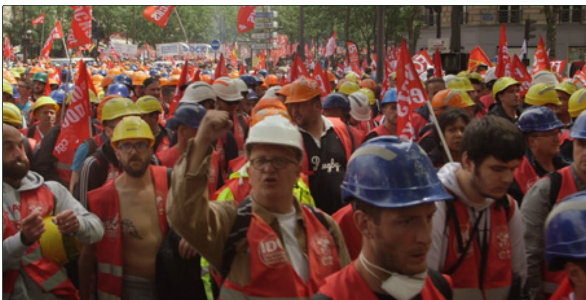
Manifestation contre la loi travail, 15 Juin 2016

Je voulais que cette histoire sonne juste, qu'elle soit directement liée à la mémoire des Havrais et que ce ne soit pas un récit historique ou de spécialiste. Il fallait que ça résonne dans le vécu des gens.